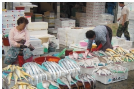
写真1：韓国チャガルチ市場