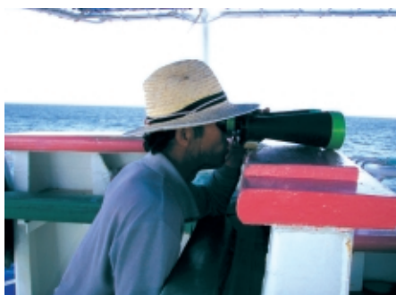
遠くにいるカツオの群れをこうして探します