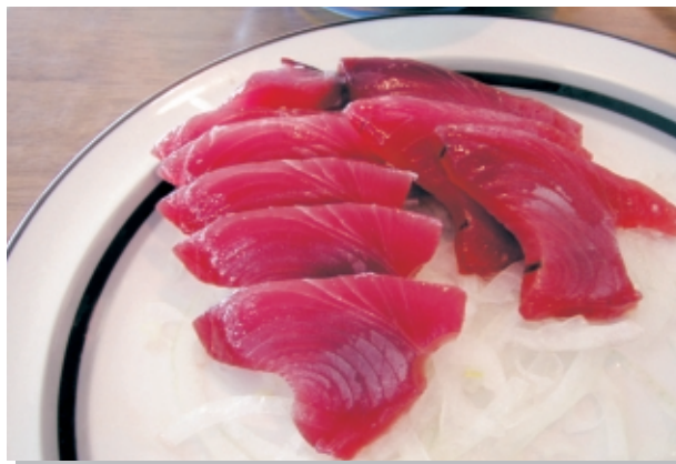
見てください、この新鮮な刺身！これがS1カツオです

日本近海のかつお釣り漁船と違って、遠洋かつお釣り漁船は一度出港すると2ヶ月ほどは戻ってきません。そのため、釣ったカツオを冷凍して魚倉に保管し、日本の港に持ち帰ることになります。魚を長期間新鮮なまま保存するための遠洋かつお釣り漁船には急速冷