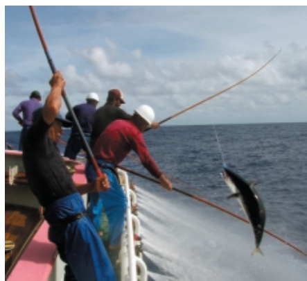
よいしょっ！獲ったどー！