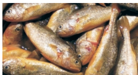
写真3：中国福建省産キグチ

文：時村宗春 西海区水産研究所 写真1：金巻清一 マリノフォーラム21 写真2、3：浅野謙治 西海区水産研究所