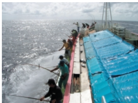
1人1本の竿で一列に並んで釣り上げます