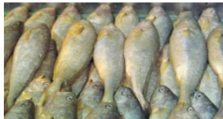
写真2：中国大連産キグチ