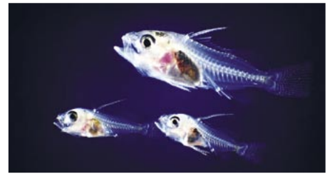
ふ化後 28 日目の稚魚

キジハタは、本州中部以南の瀬戸内海、日本海、朝鮮半島南部から中国、台湾あたりまで分布する小～中型のハタ科魚類です。潮通しのよい岩礁地帯に棲んでいて、エビ、カニなどの甲殻類や魚類などを好んで食べ、大きいものは全長 50cm くらいになります。九州では一般的にハタの仲間をアラと呼び、キジハタは長崎地方でアカアラと呼ばれていますが、キジハタの学名 Epinephelus akaara はここから付けられたと言われています。