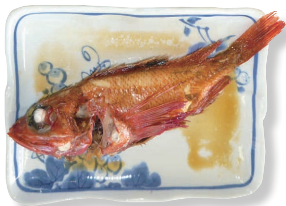
📷 4. 煮付け