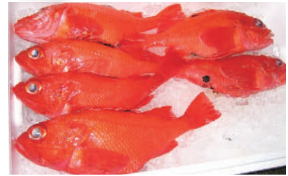
📷 2. 鮮やかな朱色の体

キチジは、キンキ、キンキン、メンメなどとも呼ばれる高級魚です。ロシアから北海道、三陸にかけての太平洋の水深350～1,300メートルの海底に住んでいます。世界には3種類のキチジの仲間がいて、日本の近くにいるキチジのほかに、カナダ・アメリカ沖合にアラスカキチジとヒレナガキチジがいます。