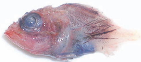
キチジの子ども(体長4センチ)

キチジは1回で1~15万粒の卵を産みます。卵はふ化するまでゼラチン状の袋に包まれて、海の表面で漂います。やがて産まれてきた子どもたちの姿は、胸びれが黒く、ずんぐりしています。キチジの子どもは、研究者もあまり見ることができない大変めずらしいものです。この姿で一生懸命に泳いでいるのを想像するとユーモラスですね。