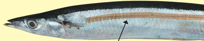
矢印の部分にある線が側線

さかなには、人間にある耳たぶや耳の穴がないので、外見からはさかなの耳がどこにあるのかわかりません。頭の中に内耳という部分があり、ここで水中から伝わる音や振動を感じとります。体の横にある側線からも音を感じとることができます。