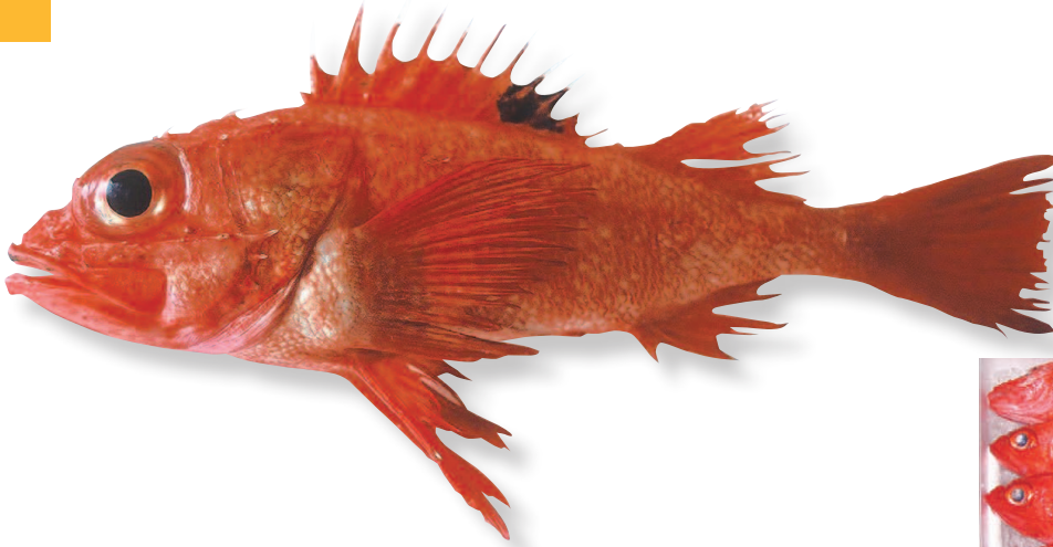
📷 1. キチジ (体長20センチ、6歳くらい)