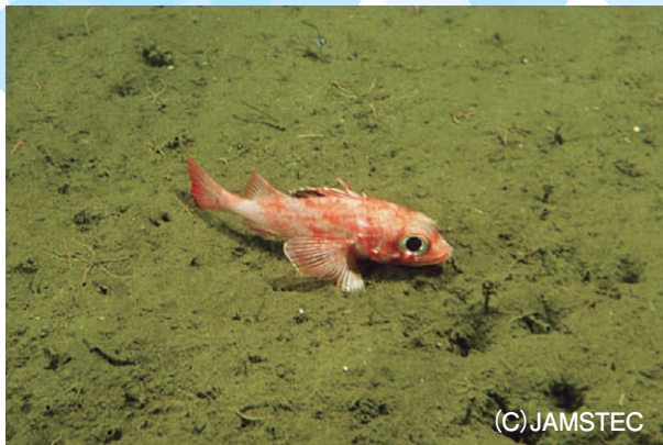
📷 3. 海底にじっとしている (写真では撮影用にライトをあてています)

寿命は長く20歳くらいまで生き、アラスカキチジは100歳くらいまで生きるともあります。1歳くらいまでは海中を泳いで生活していますが、大きくなるとあまり活発に動き回らなくなるようです(🔍