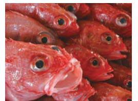
みやぎけんいしのまきまきこう みずあき 宮城県石巻漁港に水揚げされたキチジ