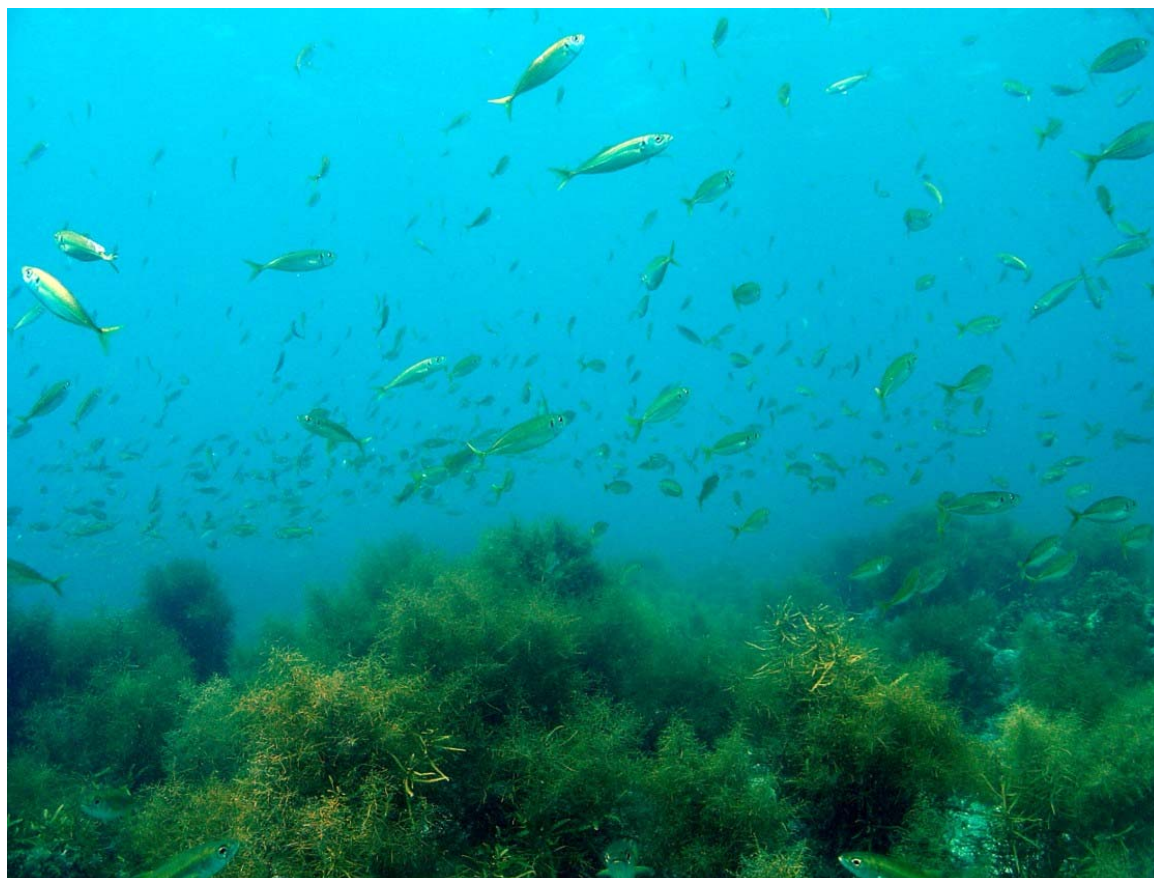
海のゆりかご 藻場 (泳いでいる魚はアジとムツの幼魚です)