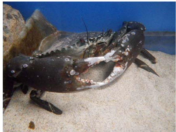
写真1 飼育中のアミメノコギリガザミ

めて難しく、ふ化した稚ダコが何を食べているかがわかっていないため、日本では過去にマダコで2,3の成功例しかありません。そのため、まず適正な餌料や飼育条件等の解明に取り組み、安定した種苗生産技術の開発に取り組みます。