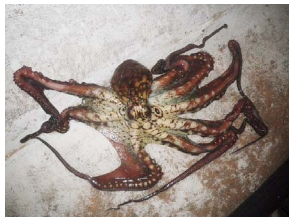
写真2 飼育中のワモンダコ

発行：国立研究開発法人水産研究・教育機構 編集：国立研究開発法人水産研究・教育機構 西海区水産研究所 〒851-2213 長崎県長崎市多以良町1551-8 TEL 095-860-1600 FAX 095-850-7767 ホームページアドレス http://snf.fra.affrc.go.jp 本誌掲載の文章・画像等の無断転載を禁じます。