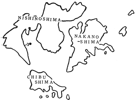
●---(AKASHIMA SET NET)

実験の方法は材料を実験室の室温（8℃～2.5℃）に放置し10時以後4時間毎に50尾宛解剖して胃内容を検査し、胃内に摂取された交接痕跡の有無によって50尾の中の交接雌の出現尾数を求め、かつ交接痕跡すなわちカラの精英外鞘と精虫嚢を検数記録して消化による組成の変化を1月23日22時まで約40時間観察した。