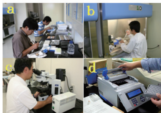
写真 不明病診断の取り組み

(a) 観察・解剖 (b) ウイルス・細菌の培養 (c) 組織観察 (d) PCR診断