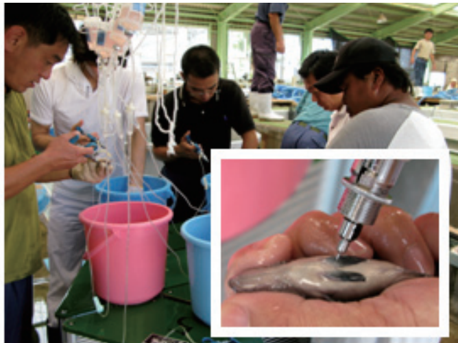
写真：注射ワクチンの接種の様子

特にVNNは様々な魚種で被害をもたらしており、ワクチンの実用化が期待されていることから、有効なワクチンの作製方法や投与方法を検討し、注射ワクチンを試作しました（写真）。この試作品を養殖場において使用したところ、VNNの感染を抑えることが実証されました。このワクチンの実用化が現在進行中です。