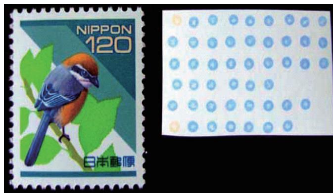
写真 魚介類病原細菌検出用 DNA チップ

DNA チップには国内で発生する既知の病原細菌の大部分と国内未侵入の重要病原細菌の 28 種類の DNA を貼り付けてあります。このチップを用い、病魚の試料との反応後、チップ上の 1 つのスポットが陽性となったとすると、この陽性スポットを示す細菌と、同種か近縁の細菌がこの病気の原因と推定できます。