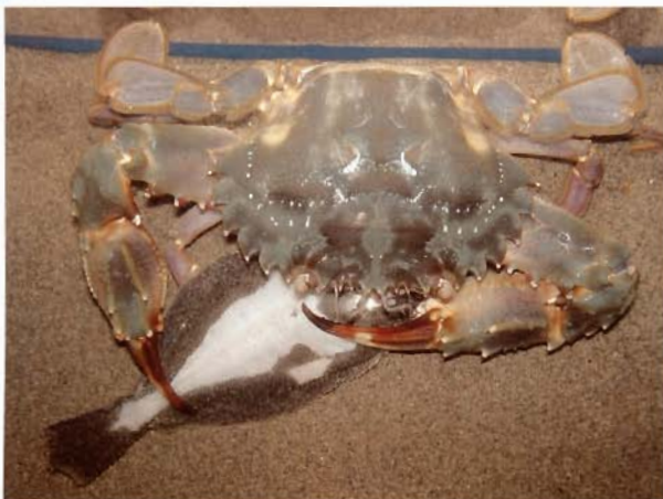
図 3 水槽内で生きたヒラメ種苗(全長 12cm)を捕食したイシガニ(甲幅 8cm)(首藤ら, 2006)。