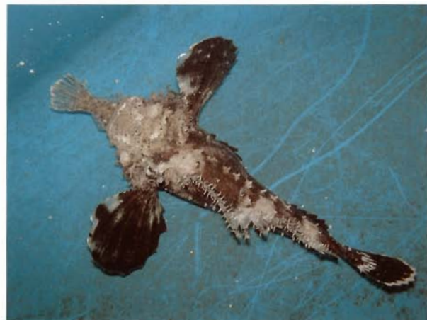
図 4 タンク内で生きたヒラメ種苗(全長 9cm)を捕食したオニオコゼ(全長 17cm)(首藤ら, 2006)。