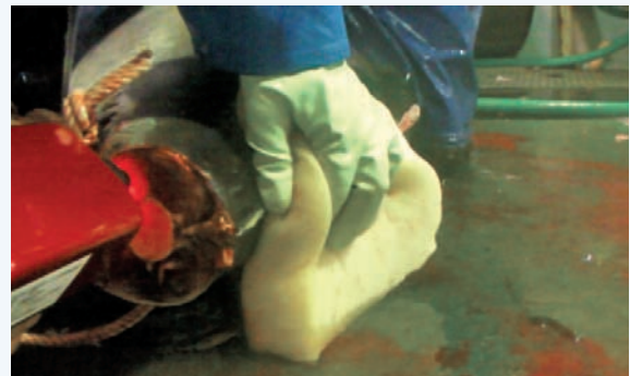
図2 ハンディ型近赤外分光装置を用いた船上測定