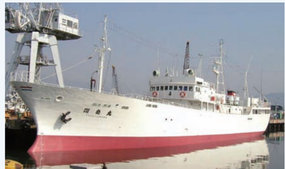
図1 開発調査センター遠洋はえなわ漁業調査船“開発丸”

示することで水揚げ後の品質の指標として、高品質魚の選別や漁場・季節毎の漁獲物調査などへの応用が期待されます。