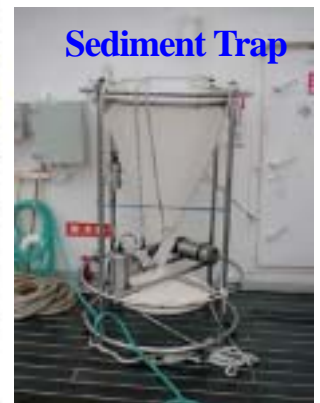
上下に計2層設置 水深1100-1500m 3500m