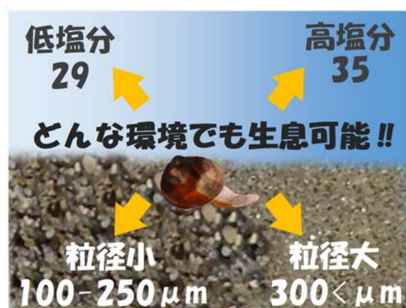
図2 飼育下では、着底稚貝の生育は底質、塩分環境に影響されない