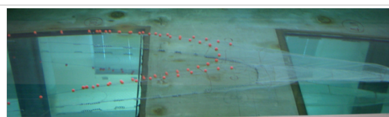
図2 水槽実験に用いた模型漁具