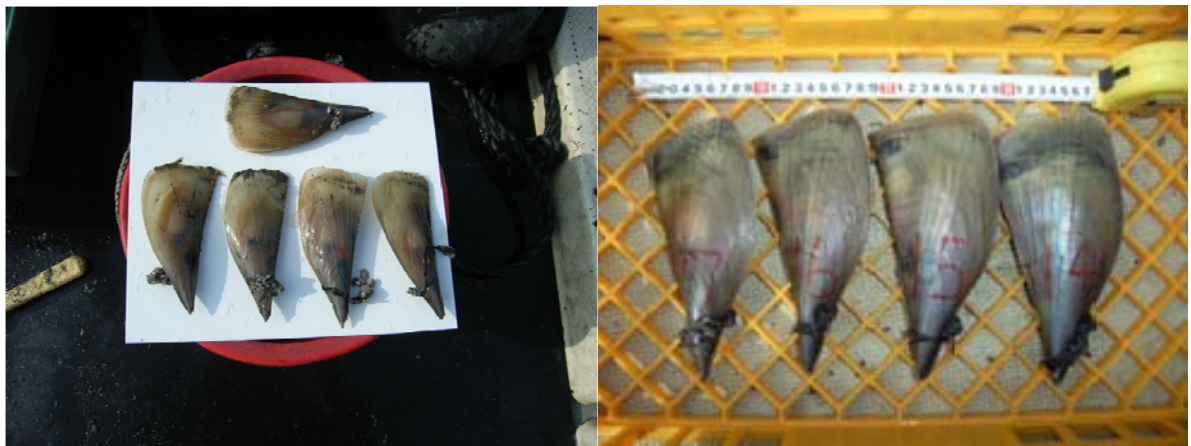
10cmサイズの稚貝が11ヶ月で20cmサイズに成長

種苗生産によりタイラギ種苗が、安価に大量に生産されることで、新たな養殖産業に拡大、発展する可能性がある。