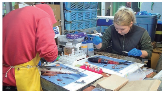
写真2 栄養・健康状態や病原体の検査のため、漁獲魚から血液、筋肉や種々の臓器を切り出す繊細な作業が船内で行われた。