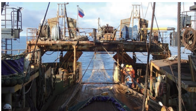
写真1 トロール投網風景。ネットソナーを用い、表層から水深30mまでを平均時速4.4ノットで1時間曳網。

漁獲されたサケマス類に個体識別タグを付け、魚種別に魚体を測定して、鱗、耳石と遺伝標本を採集しました。また、摂餌状況を把握するため胃内容物を分析し、栄養状況等を調べるために筋肉と肝臓を採集しました。さらに、成長や健康状態を把握するための採血を行うと共に、遺伝子解析で病原体の保有状況を調べるために、鰓、心臓、肝臓、腎臓、消化管、脳などを細かく切り出し、一部は組織観察用に固定保存しました(写真2)。沖合における本格的な病原体検査はおそらく初めての試みで、ストレスを受けた冬期のサケマス類に病原生物がどのような影響を与えているか注目されます。