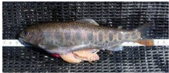
図1. 大尽内川で捕獲された抱卵ヤマメ(河川残留型雌)。

八雲町を流れる人住内川において調査をしたとき、降海型のサクラマスに混じって、31.8 cmの抱卵ヤマメが1尾捕獲された。お腹を押すと卵径