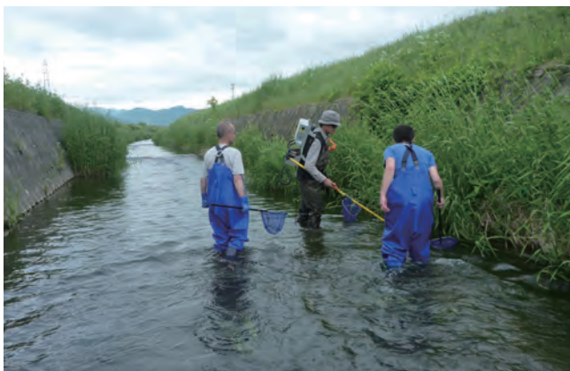
写真1 電気漁具を用いたブラントラウトの採集

振り返れば水研センターでお世話になって今年で7年目となりました。周囲の皆さんのご指導や励ましのおかげで研究を続けることができ、外来魚研究のことを「ライフワーク」と胸を張って言えるまでになりました。改めて、私の研究を支えてくださった皆さんに御礼申し上げます。