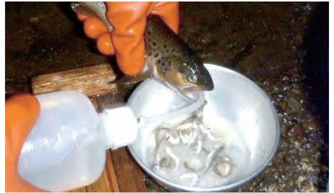
写真2 ブラントラウトが食べていた放流直後のサケ稚魚