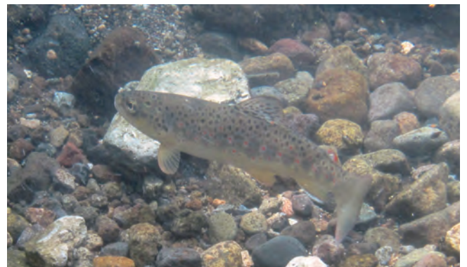
写真3 ブラントラウトの水中写真。川底にいることが多い。