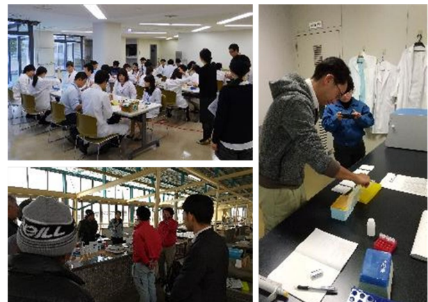
図2. 貝毒分析研修会（左）及び試験研究機関での講習会（右）による普及

するため、水産技術研究所で開催している貝毒分析研修会において講義及び実習を行ったほか、麻痺性貝毒簡易測定キットについては、希望があった民間検査機関、公設試験研究機関、漁協などで講習会を開催して普及に努めました（図2）。その結果、一部の府県では、本キットを利用した貝毒モニタリングを開始しており、効率的な監視体制が確立されました。