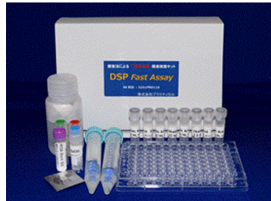
図1. 令和2年4月から市販を開始した下痢性貝毒簡易分析キット