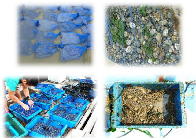
図3 アサリの天然採苗ネットとネットの中で成長したアサリ (上段)、アサリの垂下養殖容器と収穫前の様子 (下段)