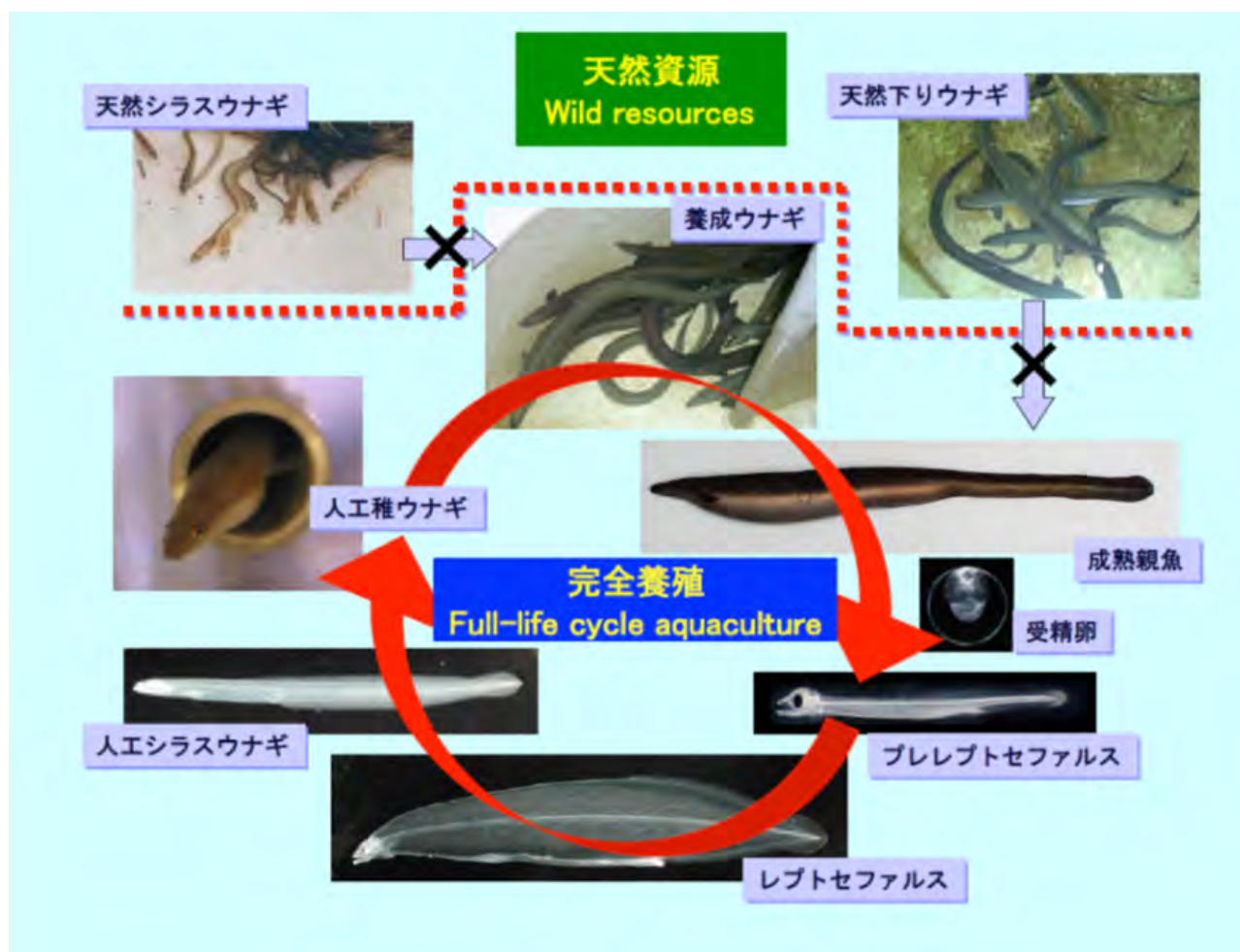
図1 ウナギの完全養殖概念図

ニホンウナギ（以下、ウナギ）は、日本列島から遠く離れたマリアナ海溝近くの海で産卵し、生まれた赤ちゃんは約半年かけて日本列島にたどり着き、シラスウナギと呼ばれる稚魚となって川に上ります。私たちが食べている養殖ウナギは、この稚魚をとって育てたものです。ところが近年、シラスウナギの数が著しく