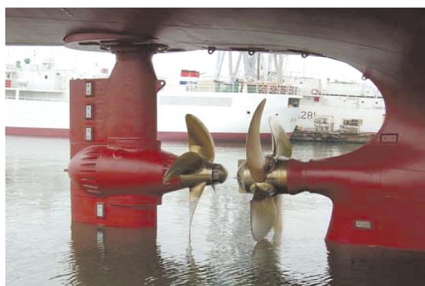
写真2 二重反転プロペラ

「クーラー式の保冷魚倉」、ブライン液に利用する「海水濃縮装置」、航行・操業の安全性を考慮した全方位視界のブリッジ、ILO基準に準じた居住区とベッドなど多くの機能、設備が改善されています。また若齢まぐろ類の調査に関しては、操業対象の魚群特性把握をねらいとして作業艇に計量魚群探知機(魚群のエコー強度を積算し、魚一匹当たりの反射強度で除して資源量の測定が可能な高性能機器)を装備しています。