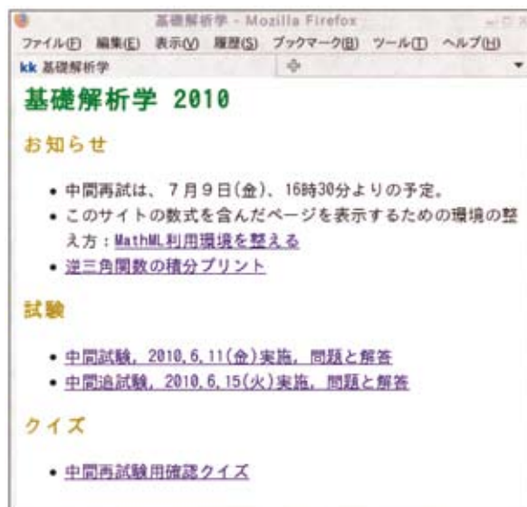
Fig. 4. The Calculus page

問題と解答の発表は、データベースに登録したクイズのページを各問解答表示ボタン付きで表示する機能を作成して、基礎解析学のウェブページ中のリンクから表示されるようにした(Fig.4)。