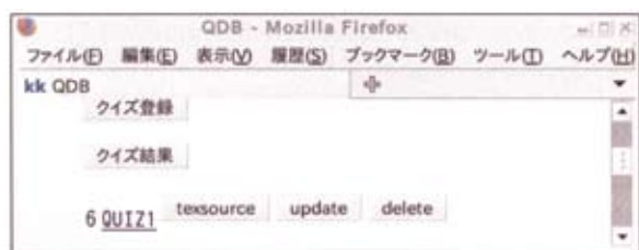
Fig. 3. The window for quiz manipulations

小テスト用にすでに、複数の問題を指定して一つの小テスト(クイズ)として登録でき、登録されたクイズを \text{L}^{\text{A}}\text{T}_{\text{E}}\text{X} ソースに落としてそのままコンパイルして印刷できるような仕組みはできていた(Fig.3参照)。これを中間・期末に使うのは問題さえ揃えば大変便利であることが分かった。使いたい問題の問題番号をコンマ区切りで書き、クイズとして登録したらtexsourceボタンを押して \text{TeX} ファイルとして保存する。このままでもコンパイルは通るが手を入れてから \text{platex} にかけてもよい。問題作成の手間も \text{L}^{\text{A}}\text{T}_{\text{E}}\text{X} コーディングの手間も省けて非常に短時間で小テストや定期試験のマスターが刷り上がる。